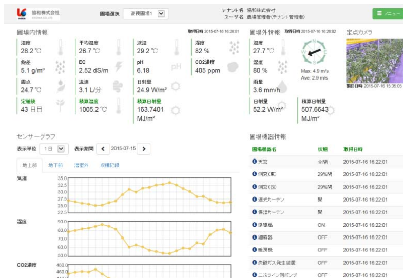
図 2: クラウドサービスメイン画面